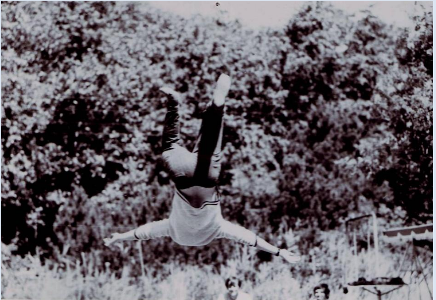
1969: i baggrunden træer langs Ranunkelvej på ubebygget grund R2A, set fra syd inde på matrikel D44A's græsplæne