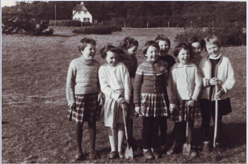
marts 1960: engen med telefonpæl til venstre bag pigefødselsdag