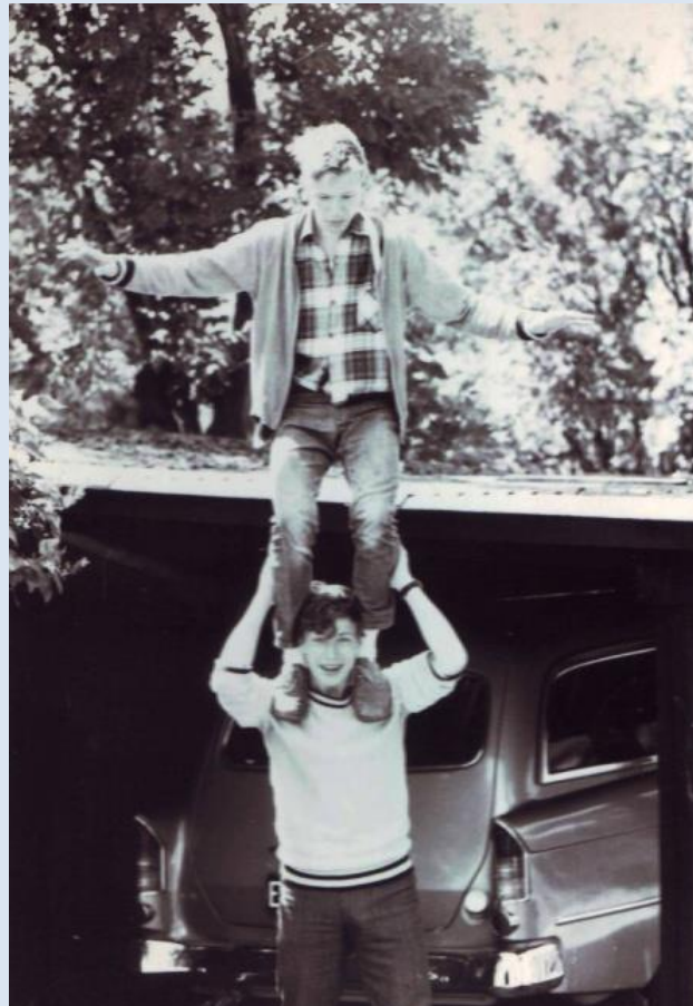
1969: D44A i fineste ekvibrilistiske øvelse