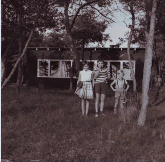
1960 foran R17

Gamle R17-fotos: pæle og bevoksning på engen - øverst på Ranunkelvej – og så et par lokale akrobater