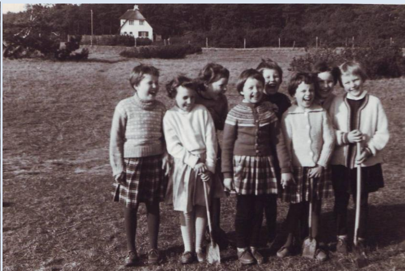
marts 1960: engen med telefonpæl til venstre bag pigefødselsdag