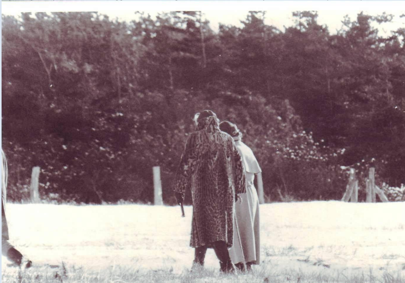
1973: vinter med let snelag på engstykket vest for diget, til højre pæle der markerer indgangen til Solsikkevej