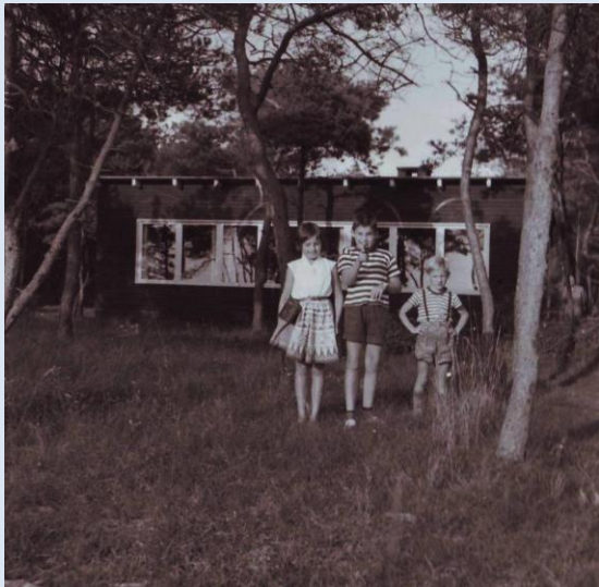
1960 foran R17

Gamle R17-fotos: pæle og bevoksning på engen og øverst på Ranunkelvej – samt et par lokale akrobater